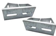
ウインチ取付金具